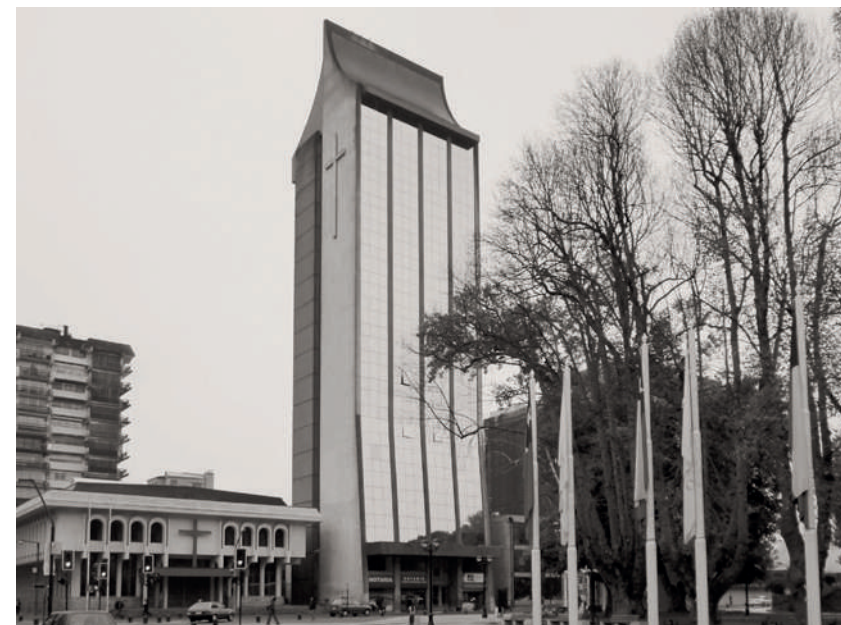
CATEDRAL DE SAN JOSÉ DE TEMUCO - 1981

Siendo Monseñor Bernardino Piñera obispo de Temuco, siempre le preguntaban cuándo reconstruiría la catedral. Y él decía: “Estoy empeñado en construir una catedral de piedras vivas, cuando tengamos en Temuco una Iglesia de gentes, ellas construirán la catedral, yo no la voy a construir” 66 . Luego reconoció con admiración la labor de Monseñor Contreras: