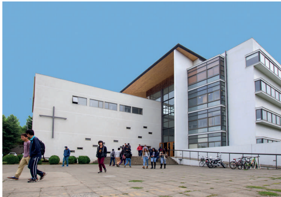
EDIFICIO CINCUENTENARIO, INAUGURADO EN 2009 - HOY EDIFICIO ADALBERTO SALAS

La interpretación de la CNA fue controvertida. Algunos opinaban que es distinto analizar las decisiones financieras de una institución desde la perspectiva de la caja chica, desde la perspectiva contable, que desde la perspectiva de la inversión. En el caso de la Universidad Católica de Temuco, ¿quién podría afirmar que la deuda que estaba adquiriendo no iba asociada a su desarrollo, que si se aumentaba el patrimonio