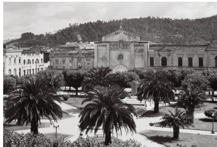
PLAZA ANÍBAL PINTO CON LA CATEDRAL DE TEMUCO EN LA DÉCADA DE 1950