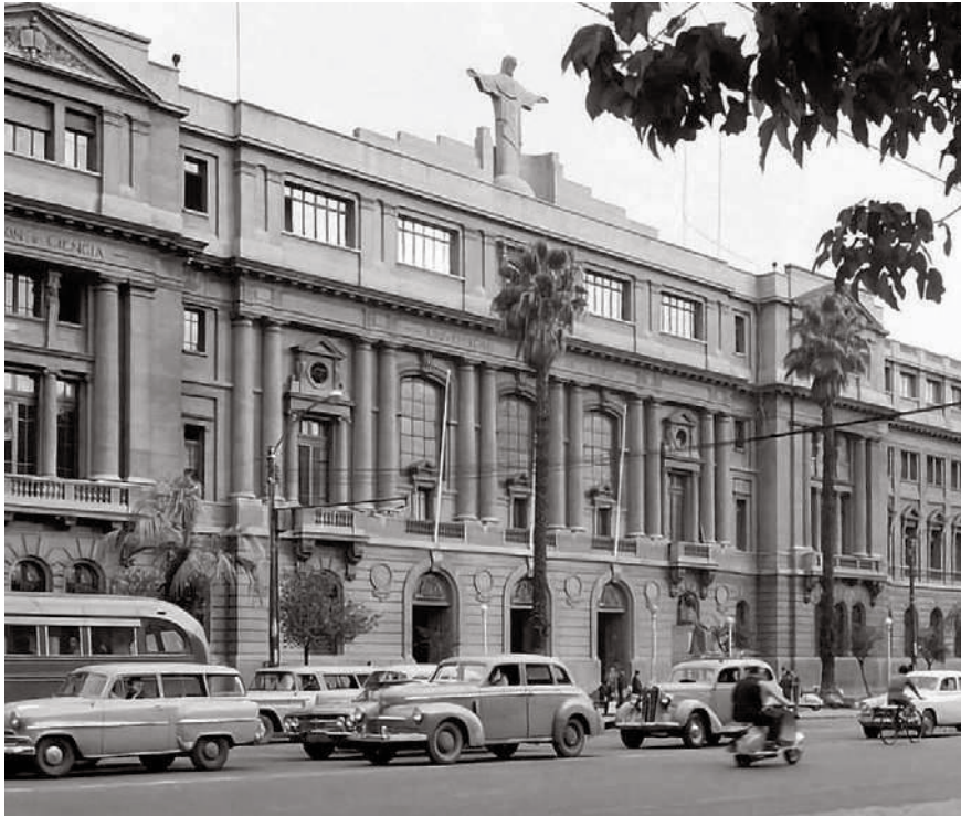
CASA CENTRAL DE LA PONTIFICIA UNIVERSIDAD CATÓLICA DE CHILE - SANTIAGO 1960

Monseñor tantea el terreno, contrapropone buscando el modo de perforar con su sencilla adarga de obispo el amurallado bastión de la normativa institucional. Aquí lo vemos apelando a una sutil estratagema, al exponer la posibilidad de que la recién creada institución diocesana sea absorbida por el clásico competidor de la Universidad Católica en la cancha de juego universitario: la Universidad de Chile.