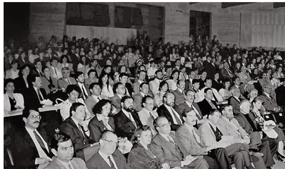
INAUGURACIÓN DEL AULA MAGNA EN EL CAMPUS SAN FRANCISCO - DICIEMBRE 1990