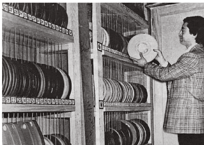
CINETECA DE LA UNIVERSIDAD DE LA FRONTERA - 1972