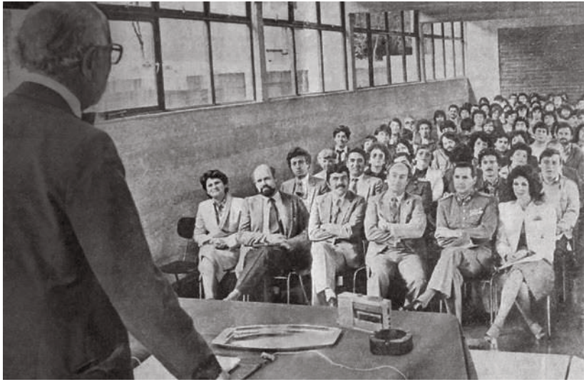
JOAQUÍN LUCO, PREMIO NACIONAL DE CIENCIAS, INAUGURA LA QUINTA SEMANA INDIGENISTA - 1983

de esa Quinta Semana Indigenista, realizada al amparo del Centro de Investigaciones Sociales Regionales, CISRE, fueron recogidas en los primeros números de la revista CUHSO (Cultura, Hombre, Sociedad) 72 .