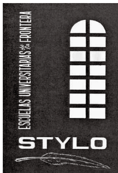
REVISTA STYLO - 1965