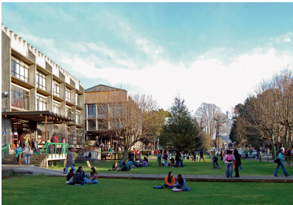
ESTUDIANTES SOCIALIZANDO EN LOS JARDINES DEL CAMPUS SAN FRANCISCO - 2006

recibió el llamado de la presidenta Michelle Bachelet para integrar el Consejo Asesor Presidencial para la Educación Superior.