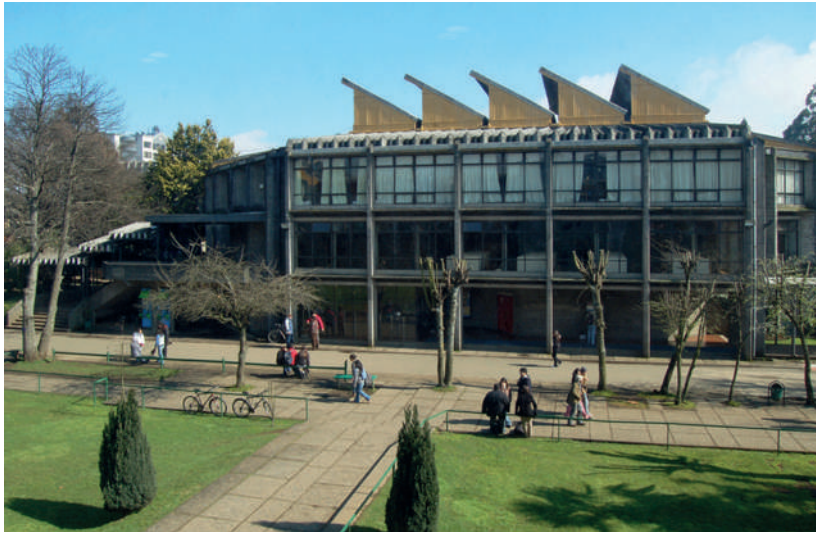
EDIFICIO PARA LA BIBLIOTECA Y EL AULA MAGNA EN EL CAMPUS SAN FRANCISCO - 1990