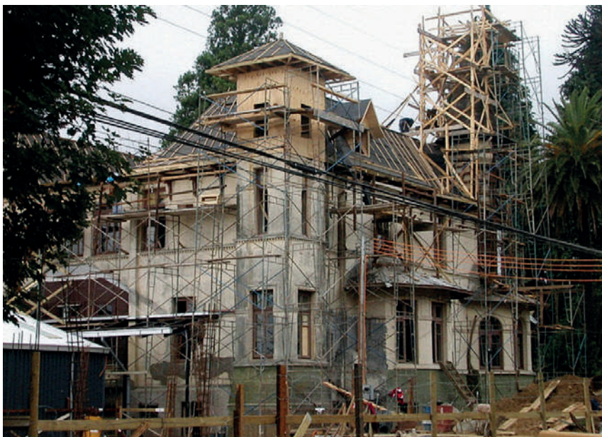
OBRAS DE RESTAURACIÓN DEL CAMPUS MENCHACA LIRA - 2002

ciudad de Temuco. Es decir, podríamos convenir en que forma parte de un ecosistema.