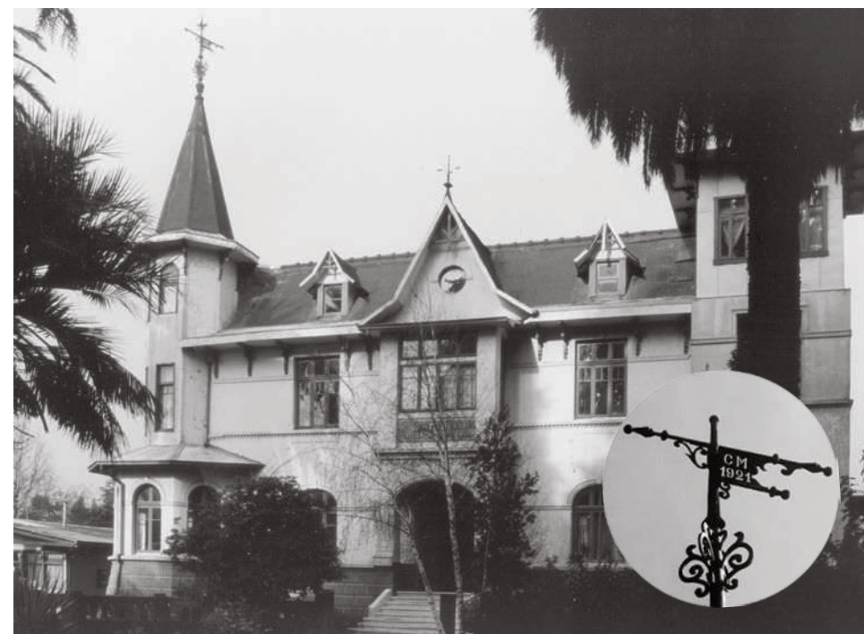
CASA MALMUS EN AVENIDA ALEMANIA 0422, ADQUIRIDA PARA LA UNIVERSIDAD EN 1963. HOY LLEVA EL NOMBRE “CAMPUS MONSEÑOR ALEJANDRO MENCHACA LIRA”. INSERTA APARECE LA VELETA CON LAS INICIALES Y EL AÑO DE CONSTRUCCIÓN DE LA CASA