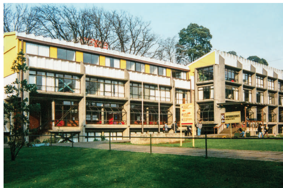
PRIMEROS EDIFICIOS EN EL CAMPUS SAN FRANCISCO - 1983