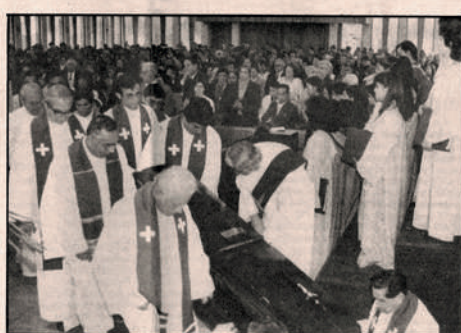
Numerosos fieles, religiosas y sacerdotes, además de los familiares del pastor, concurrieron ayer a la Catedral para participar en la ceremonia.