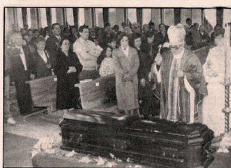
Monseñor Sergio Contreras presidió el significativo acto religioso, que obedece a una antigua tradición de la Iglesia Católica.